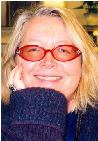
キネ オーネ (ノルウェー)