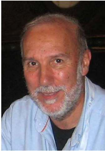
フェラン ガヤート (カタルーニャ／スペイン)