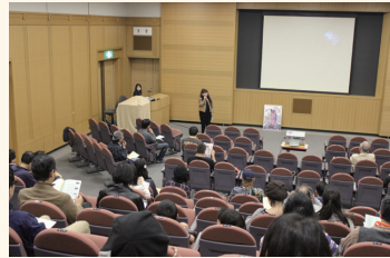
国際アニメーション・デー 2015

また、年間を通じて小・中学生を対象にしたアニメーション制作教室や、パラパラアニメーションコンテスト、美術教員へのアニメーション制作ワークショップや、中・高等学校での特別授業の実施、中学校美術部を対象にしたアニメーション制作支援なども行っています。さらに国際アニメーション・デー（10月28日）に合わせた市内外の美術館等での受賞作品の上映会など、アニメーションの普及を目指し、市民のみならずが楽しめる関連事業も実施しています。