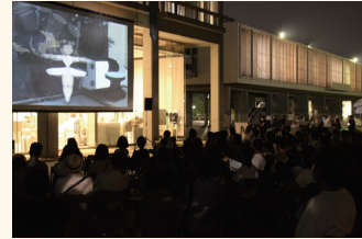
平和のためのアニメーション野外上映会

旧日銀広島支店での100日前記念イベントや、8月6日の平和記念公園での平和のための野外上映会など街の賑わいづくり、地域活性化への取り組みも実施しています。