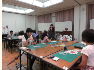
アニメーションワークショップ 2015