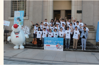
広島国際アニメーションフェスティバル 100日前イベント