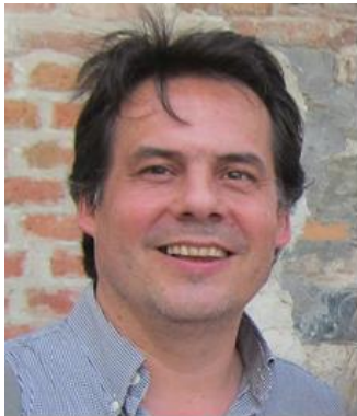
オリヴィエ カテラン (フランス)