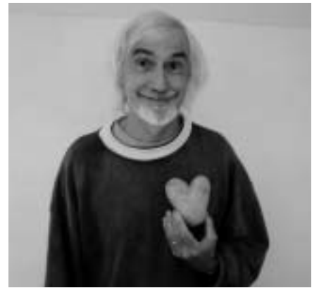
国際名誉会長 ポール・ドリエセン

国際名誉会長に、アカデミー賞ノミネート作家であり、ビートルズをアニメーションにした「イエロー・サブマリン」(ジョージ・ダニング監督、1967年)への制作協力でも知られるポール・ドリエセン氏を迎え、世界でも最高の質と定評があるコンペティション(公開審査)のほか、日本初公開やアジア初公開を含む多数の特別プログラムを一挙上映します。また、教育機関とプロの世界を結ぶ「エデュケーショナル・フィルム・マーケット」や持ち込み上映なども可能な「ネクサス・ポイント」「フレーム・イン」、子ども達がアニメーション制作を体験できる「キッズ・クリップ」、アニメーション関連の展示など盛りだくさんの内容を予定しています。広島でしか観ることのできないアニメーションを是非ご覧下さい!!