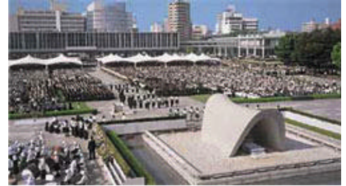
平和記念資料館前で行われる平和記念式

約4万人が参列する原爆死没者の慰霊と世界恒久平和を願う式典。広島市長による平和宣言が読み上げられる。8月5日・6日と市内各地で原爆死没者の慰霊行事が行われます。平和記念公園は、8月6日の未明から遺族が慰霊碑を訪れ、厳かな雰囲気になります。