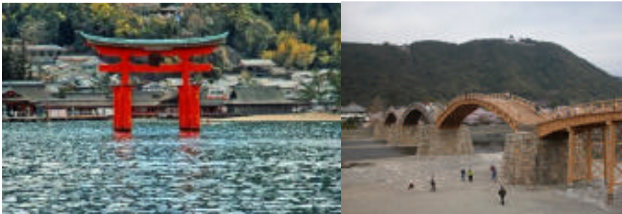
世界文化遺産 宮島

広島とその周辺には、海上に神社の社殿が浮かぶ世界文化遺産「宮島」や日本三奇橋の一つ五連アーチの木造橋「錦帯橋」もあります。